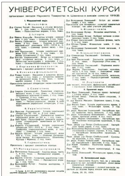
Програма університетських курсів запропонованих НТШ на зимовий семестр 1919/1920 р.

На запитання ректора, на яких умовах вони б бажали вчитися в університеті, представники „Академічної громади“ представили меморіал, де серед інших вимог відзначали, що українське студентство бажає повернення університету до стану, у якому він перебував перед початком польсько-української війни, повернення українських професорів, а також, щоб приймали до нього всіх українських студентів без застережень і без посвідчень лояльності від польських урядовців, установ чи організацій. На ці домагання ректор Махек сказав: „Щоб ставити такі вимоги, треба виграти війну. За програму війну мусите бути покарані“. На тому