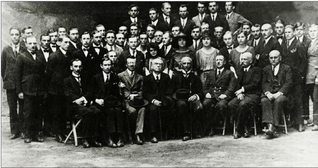
Професори та студенти правничого факультету Українського університету

Багато коштів також вкладали в хімічну лабораторію, яка розгорнулася на базі відповідної лабораторії НТШ 77 .